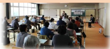
町民向け成年後見講座